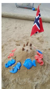
17. Mai leiker