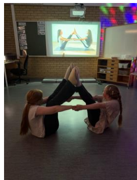
Klarer vi disse utfordringane saman?